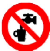
Acqua non potabile