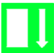
Percorso / Uscita di emergenza