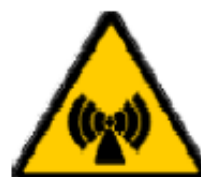
Radiazioni non ionizzanti