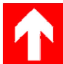
Direzione da seguire