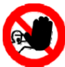
Divieto di accesso alle persone non autorizzate