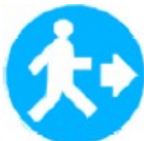
Passaggio obbligatorio per i pedoni