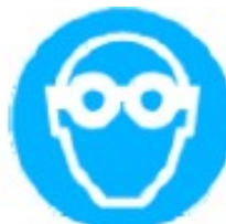
Protezione obbligatoria degli occhi