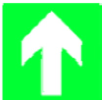
Direzione da seguire