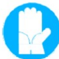
Guanti di protezione obbligatoria