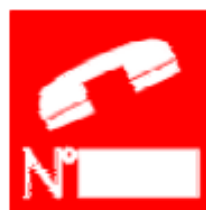
Telefono per gli interventi antincendio