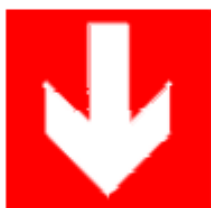
Direzione da seguire