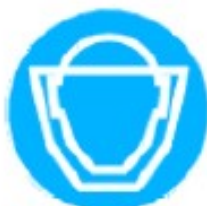
Protezione obbligatoria del viso