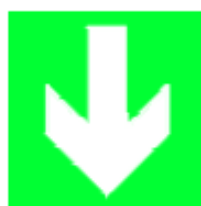
Direzione da seguire