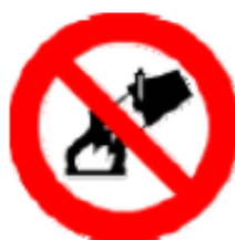
Divieto di spegnere con acqua