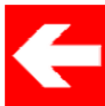
Direzione da seguire