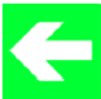
Direzione da seguire