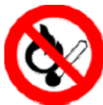
Vietato fumare o usare fiamme libere