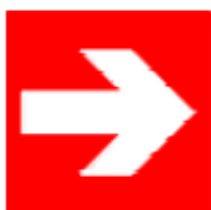
Direzione da seguire