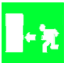
Percorso / Uscita di emergenza

(forma rettangolare o quadrata, colore verde)