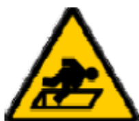
Caduta con dislivello