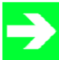
Direzione da seguire