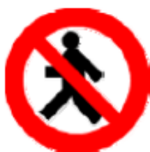
Vietato ai pedoni