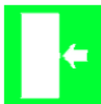
Percorso / Uscita di emergenza