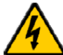
Tensione elettrica pericolosa