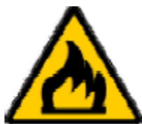
Materiale infiammabile o alta temperatura